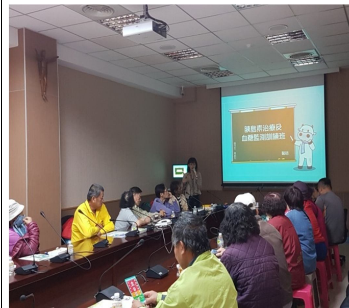
圖二、病患參與糖尿病衛教課程